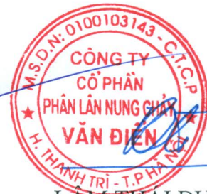
LÂM THAI DƯƠNG